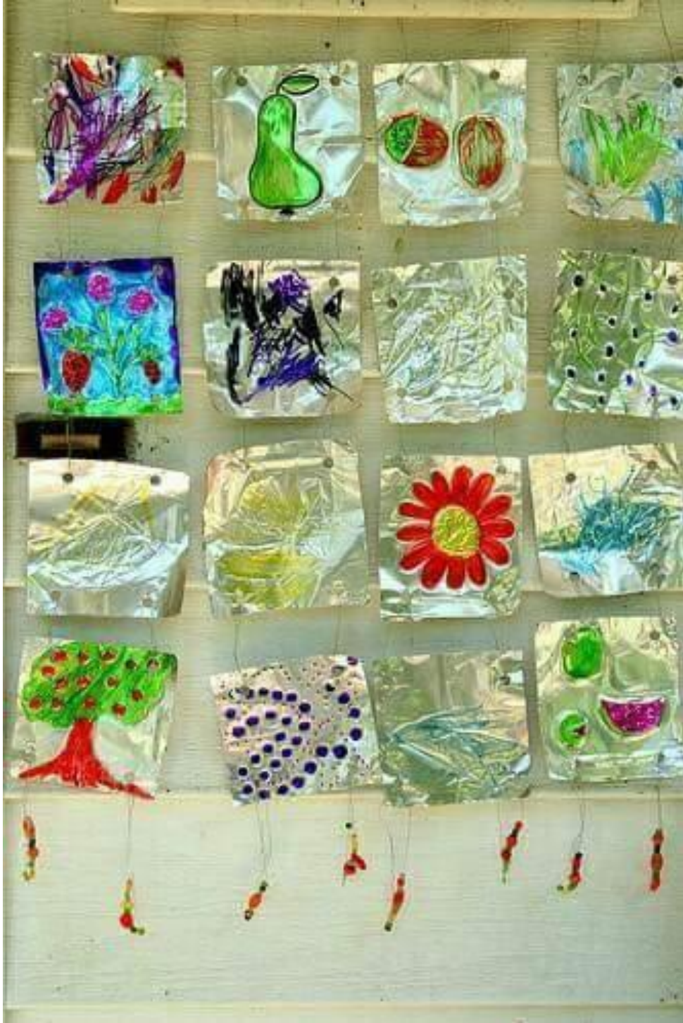
Pintura sobre papel aluminio.