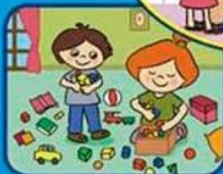
Cuando juego y guardo los juguetes