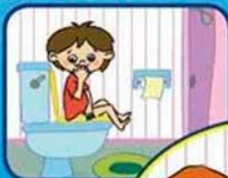
Después de ir al baño