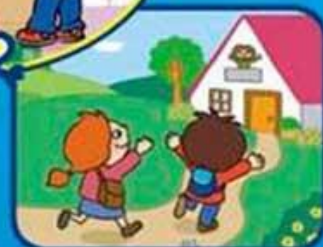
Cuando vuelvo del parque