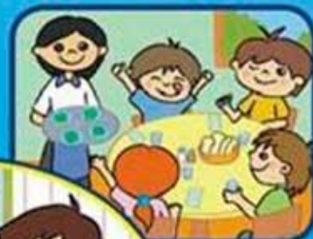
Antes de comer